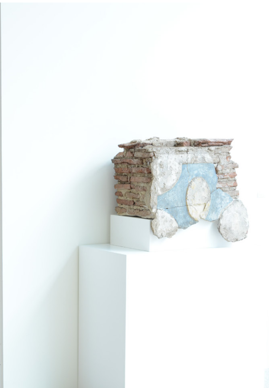
Conversadeira, Séc. XVIII 48 x 60 x 40 cm, Col. Centro de Interpretação do Jardim do Paço