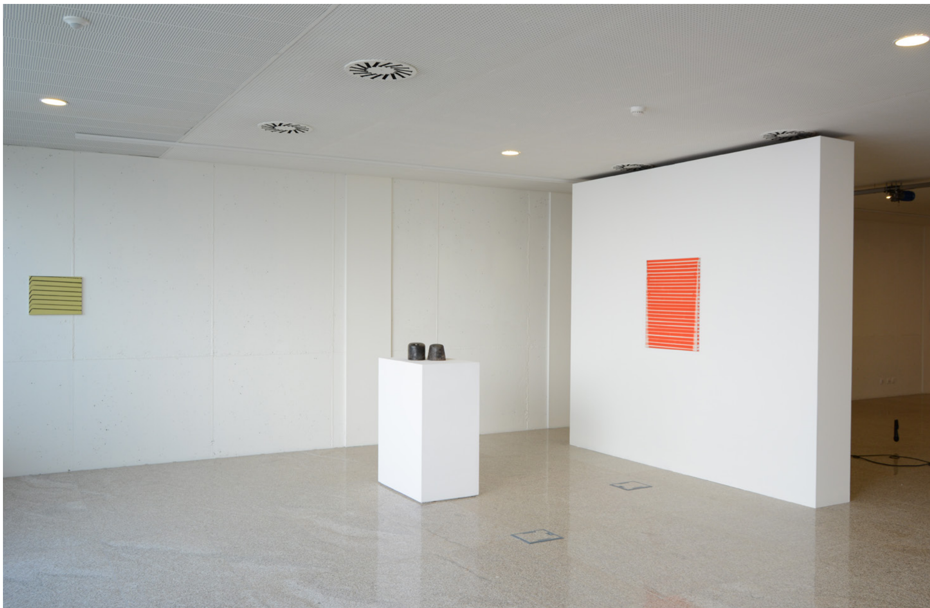
José Loureiro (1961) Sem título, 2005 Óleo sobre tela, 33 x 41 cm, Col. da Caixa Geral de Depósitos, Inv. 617975