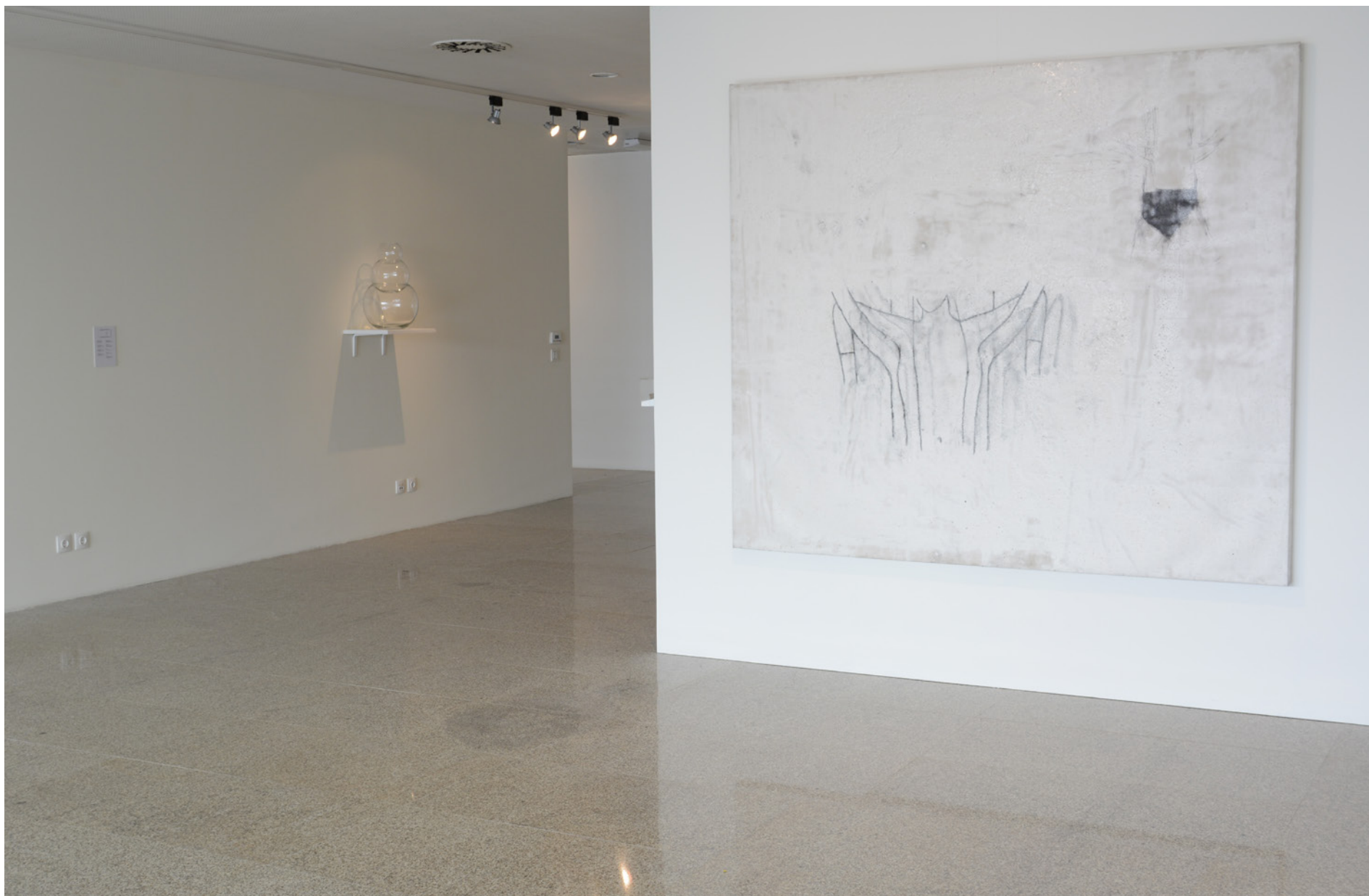
Ana Jotta (1946) Calvin , 1993 Aquários de vidro, 51 x 31 x 31 cm, Col. da Caixa Geral de Depósitos, Inv. 602185