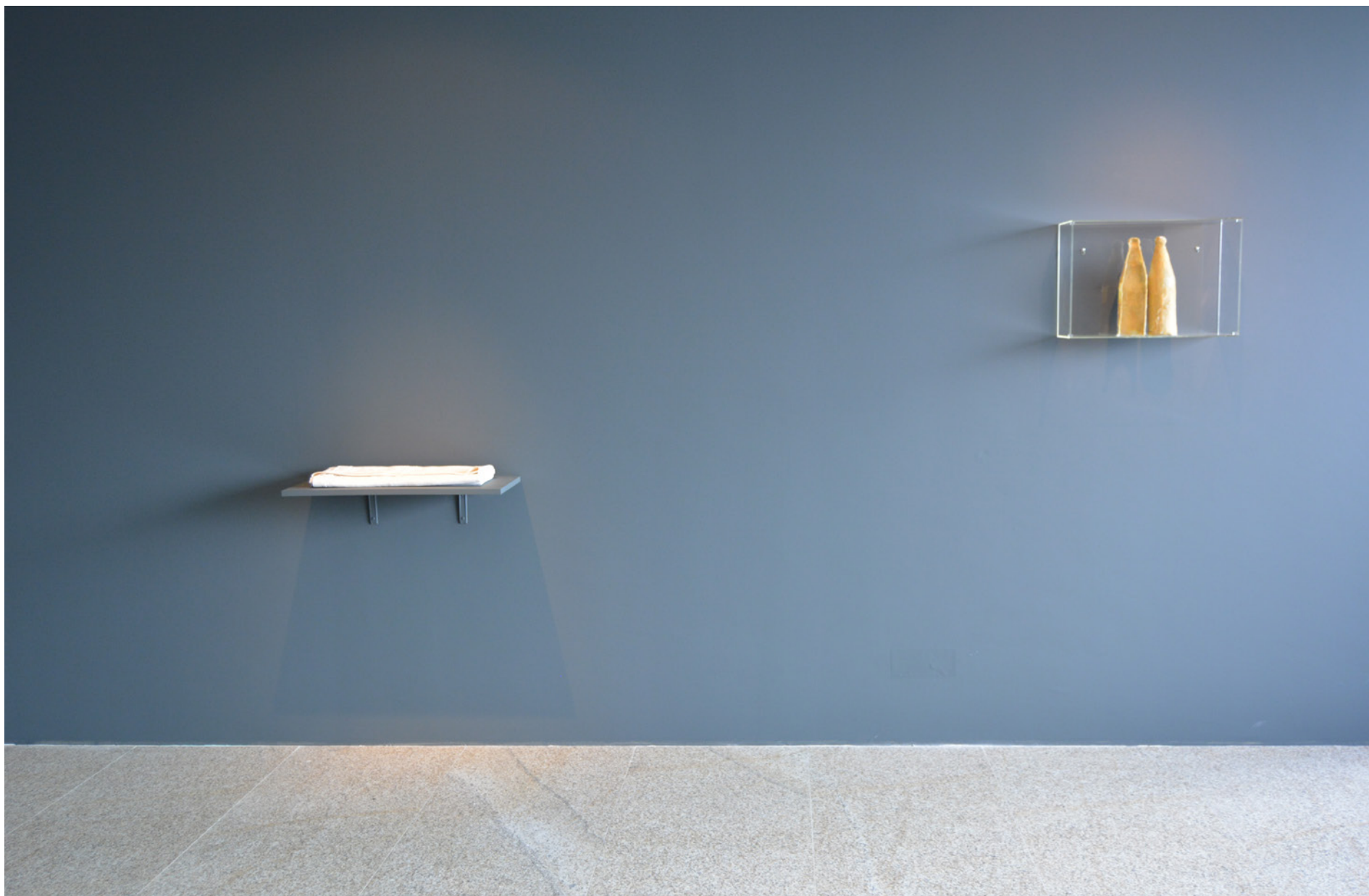
Pano dos mortos, Sécs. XIX-XX 168 x 210 cm, Col. Museu Francisco Tavares Proença Júnior, Inv. 2000.54 MFTPJ