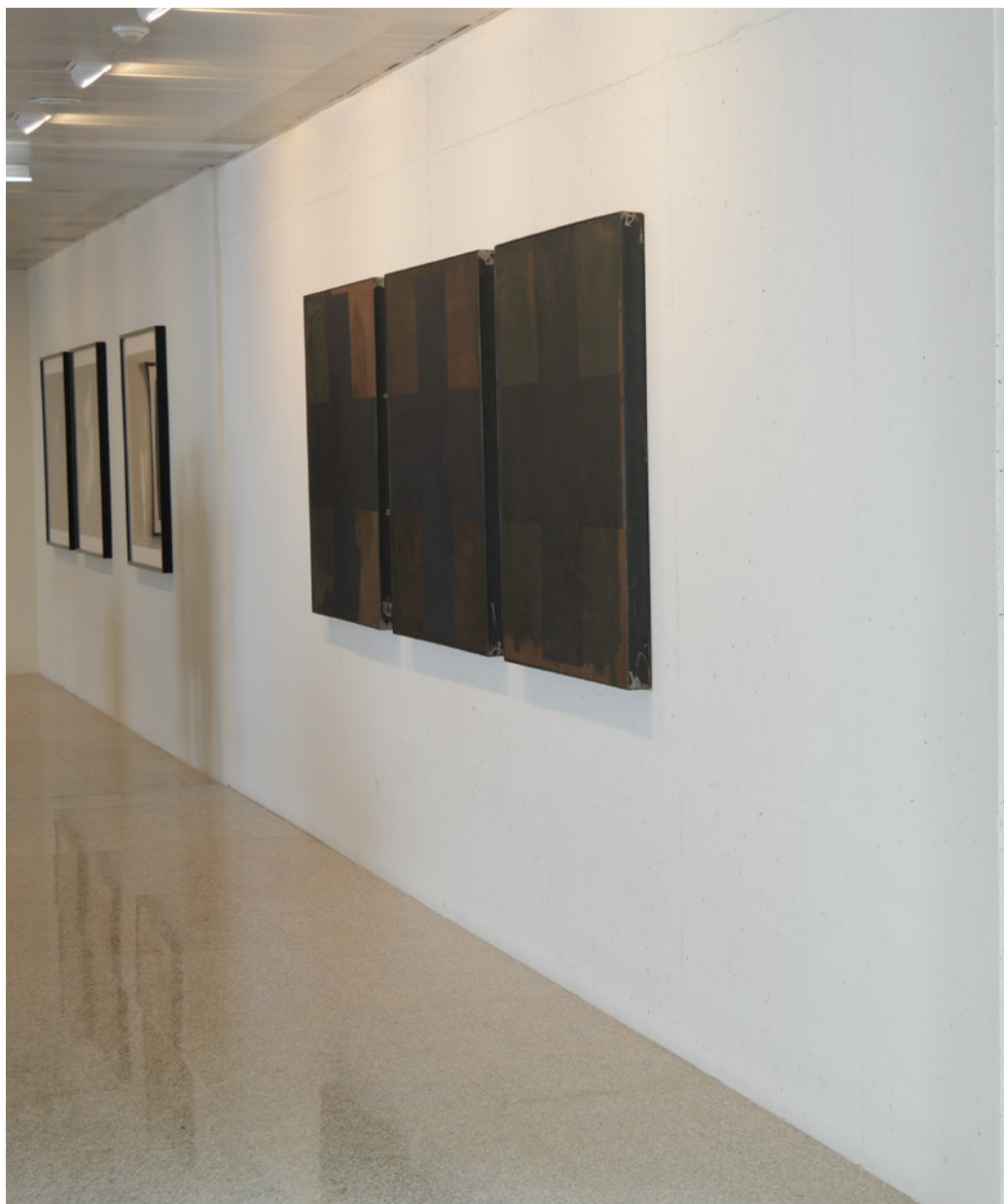
Pedro Cabrita Reis (1956) Triptico , 1986 Óleo e vernizes sobre madeira, 3 x (120 x 120 cm), Col. da Caixa Geral de Depósitos, Inv. 336297