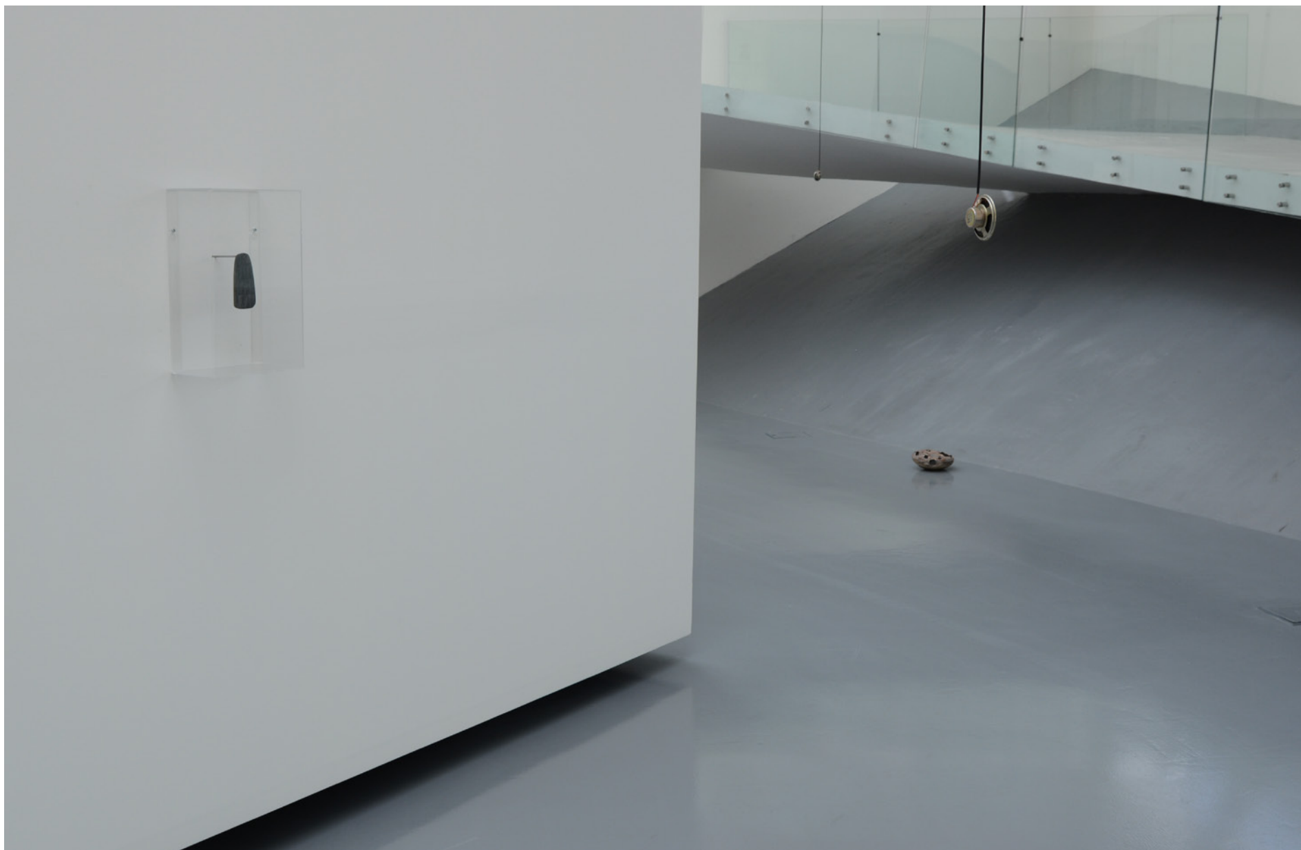
Placa votiva, Neolítico final 12,3 x 7,9 x 0,8 cm, Col. Museu Francisco Tavares Proença Júnior, Inv. 10.269 MFTFJ