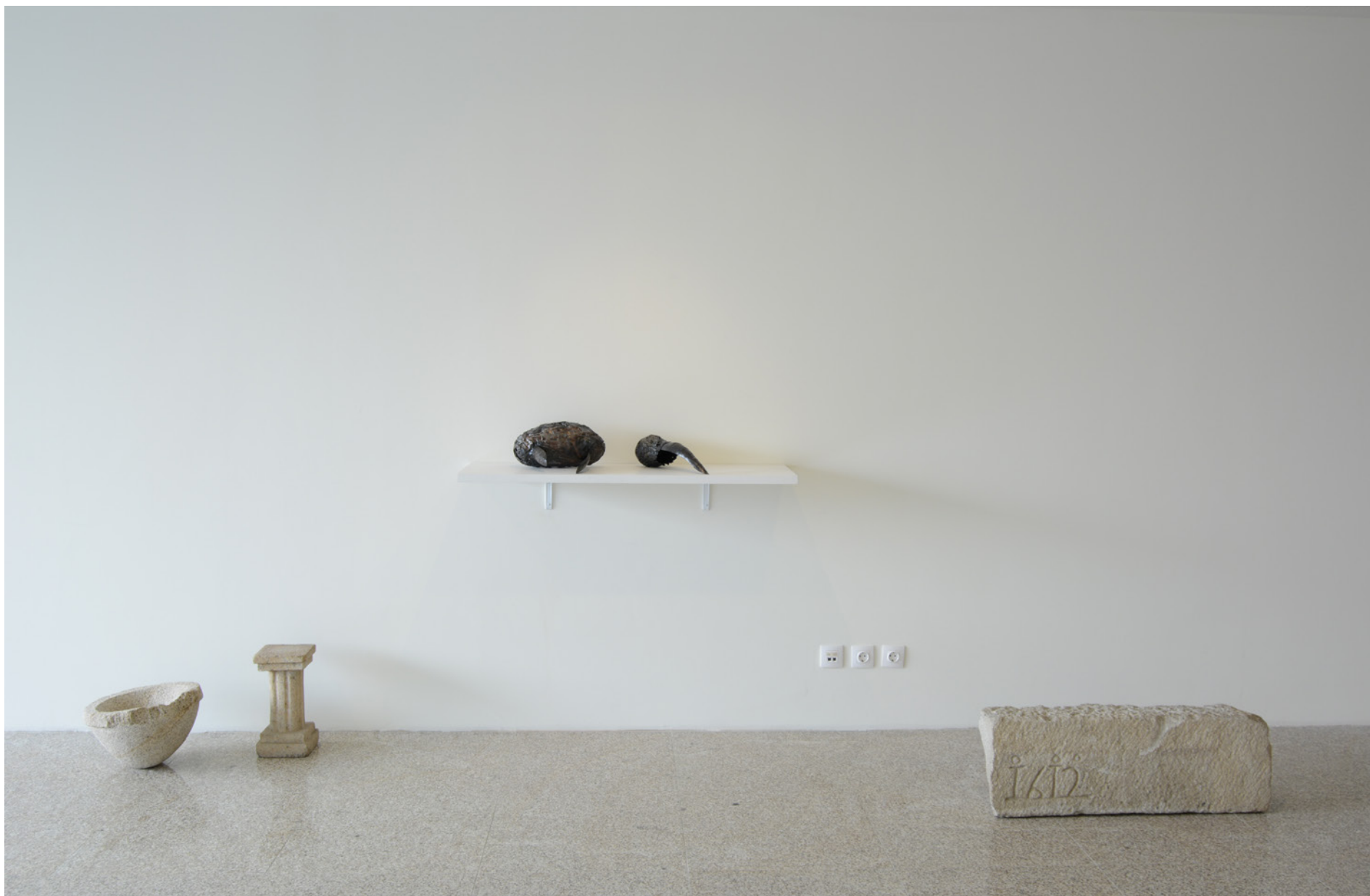
Pia, Séc. XX 38 x 38 x 18,5 cm, Col. Museu do Canteiro, Inv. MC.993.5