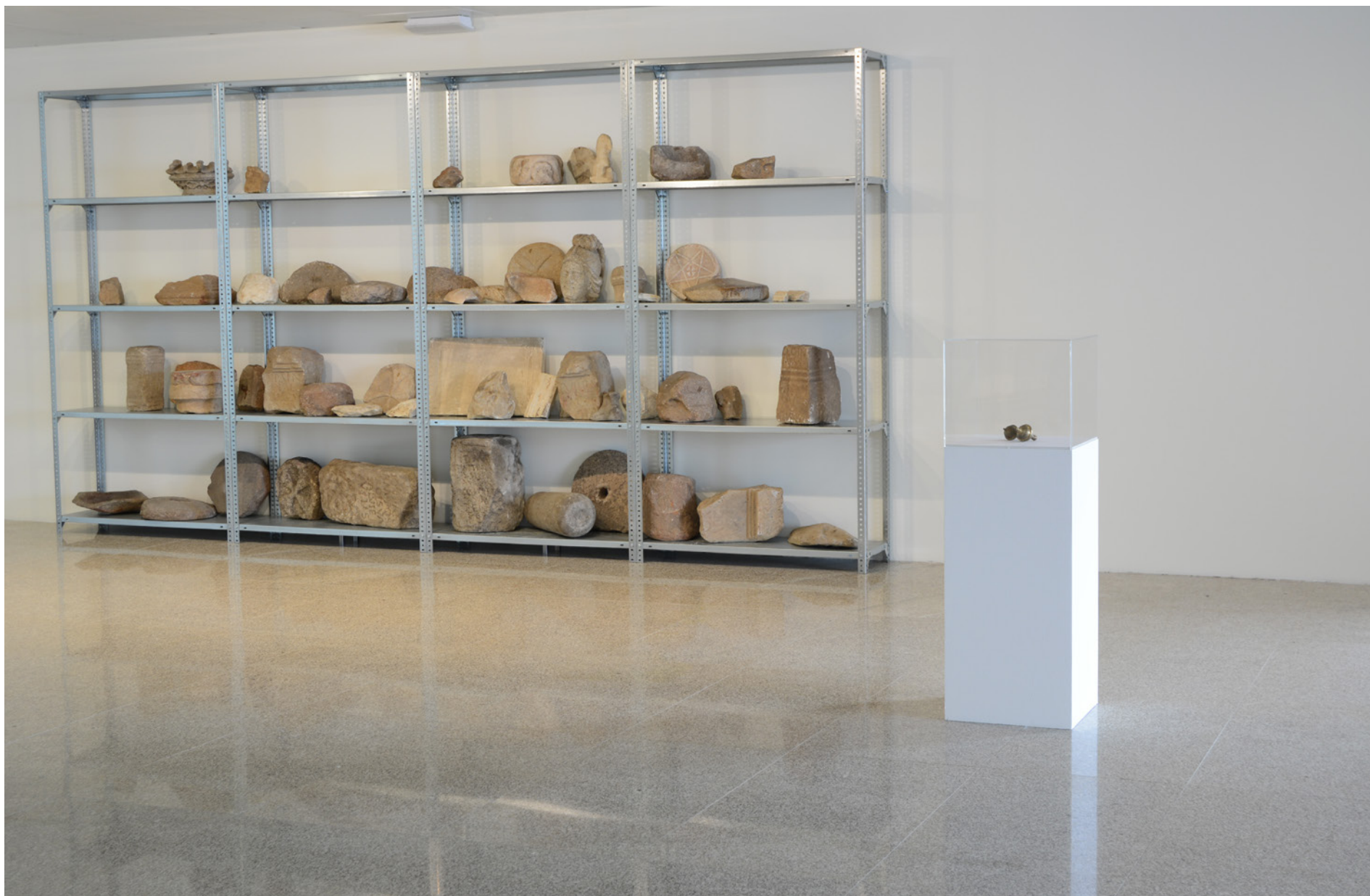
Artefactos da Reserva de Arqueologia N.º 2 Dimensões variáveis, Col. Museu Francisco Tavares Proença Júnior