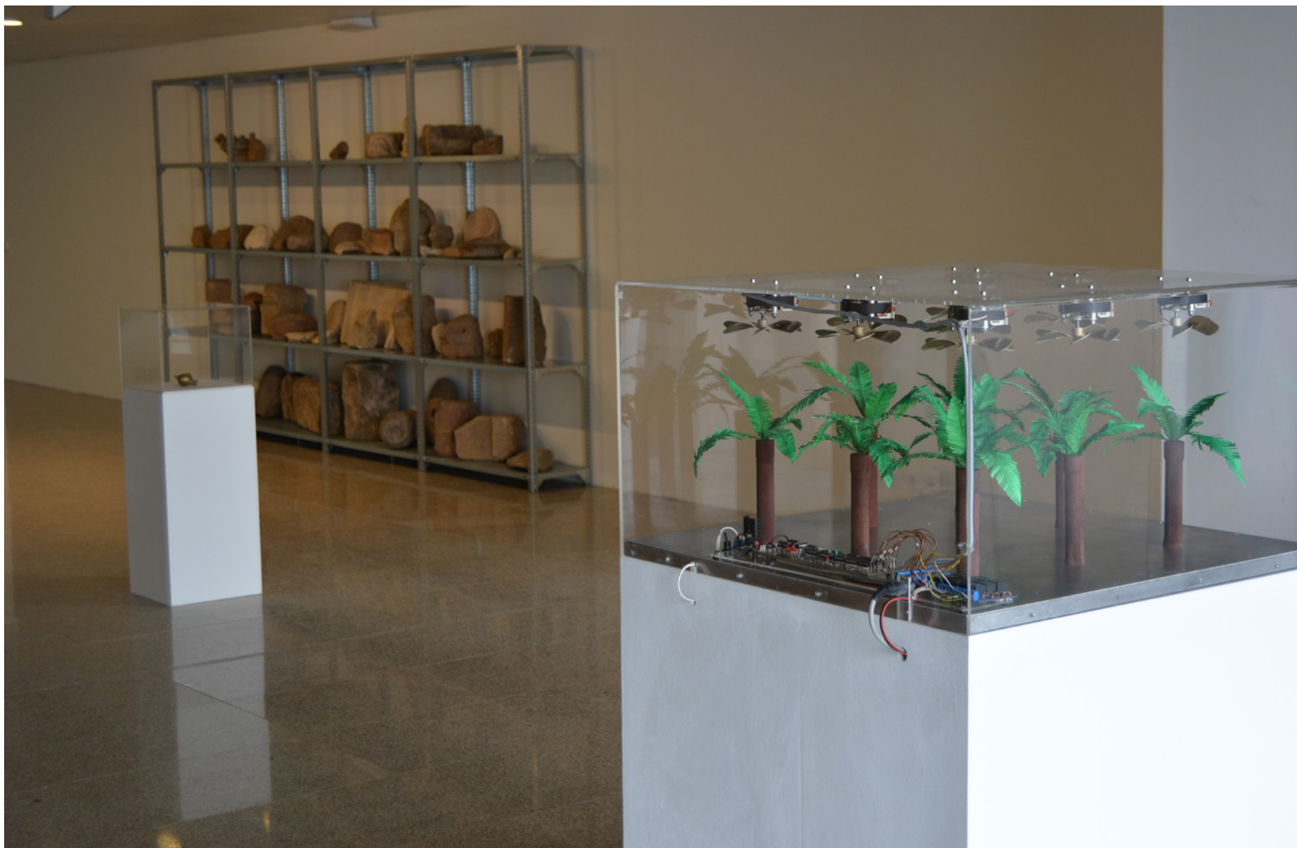
Artefactos da Reserva de Arqueologia N.º 2 Dimensões variáveis, Col. Museu Francisco Tavares Proença Júnior