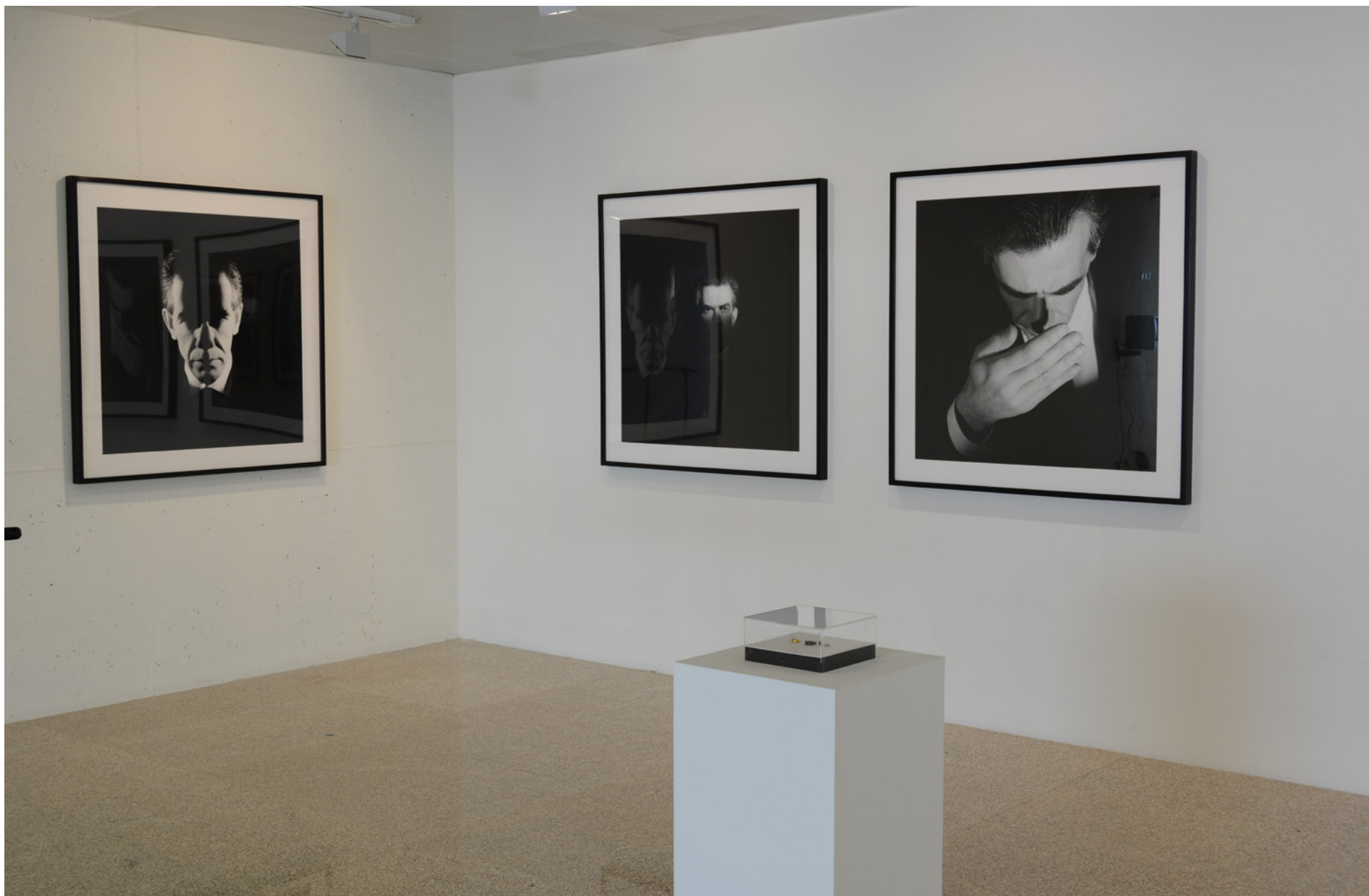
Jorge Molder (1947) Da série Inox , 1995 Prova de Gelatina Sal de Prata, 10 x (110 x 110 cm), Col. da Caixa Geral de Depósitos, Inv. 402763