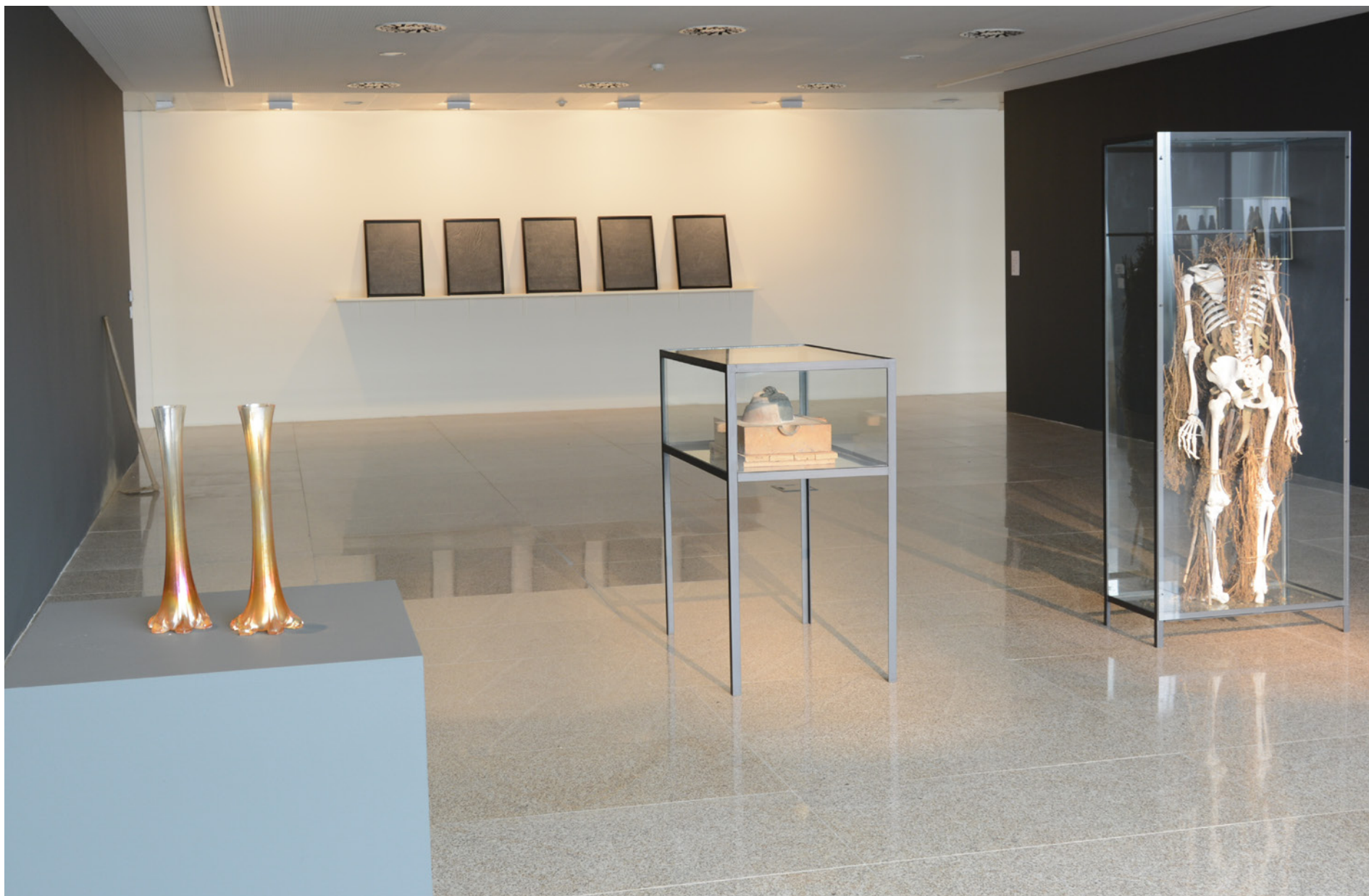
Solitários, Cronologia desconhecida 2 x (11,5 x 3,5 x 1,8 cm Ø), Col. Museu de Arte Sacra – Santa Casa da Misericórdia de Castelo Branco