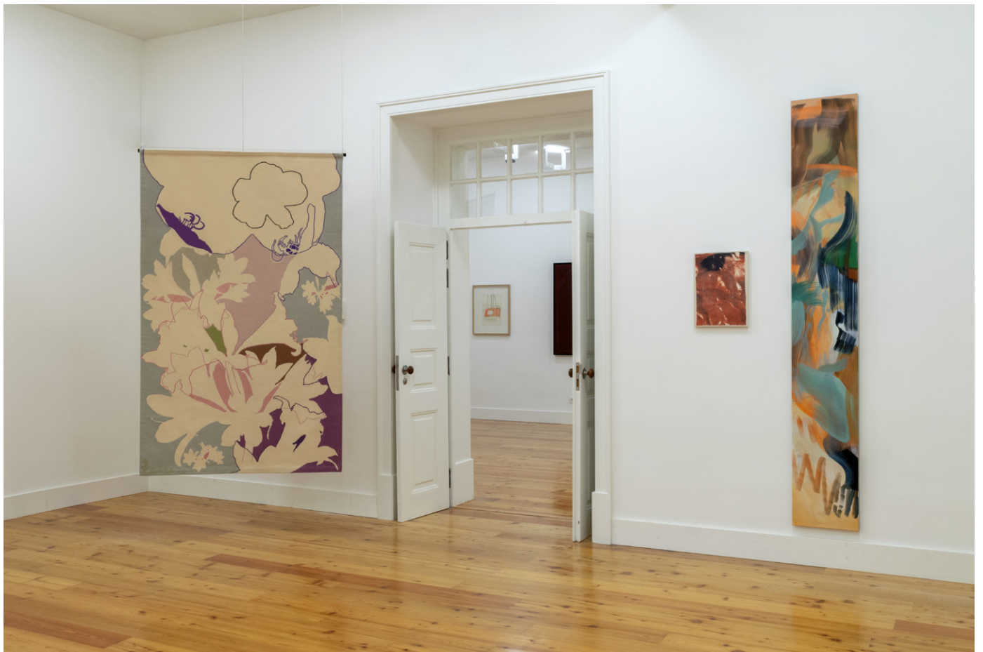
Cangiante #5 Lourdes Castro, Álvaro Lapa, João Paulo Feliciano, Ana Manso